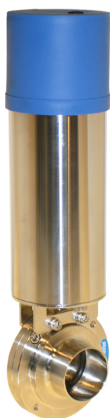
Aktuator Type 5126