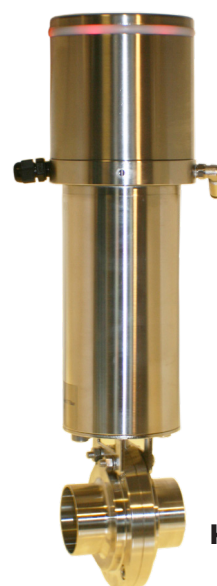
Kontrolboks Type 5326