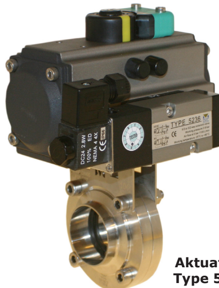
Aktuator Type 505