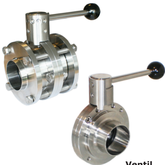
Ventil Type 2600/2610